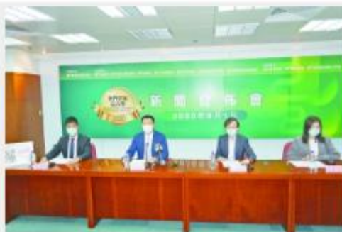
澳門會展嘉許獎新聞發佈會昨舉行