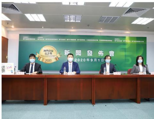
澳門會展嘉許獎接受報名

「澳門會展嘉許獎2020」由澳門會議展覽業協會主辦，澳門展覽協會、澳門廣告商會、澳門會展產業聯合商會協辦，澳門基金會、澳門貿易投資促進局、澳門旅遊局、澳門中華總商會、澳門經濟學會、中國會展經濟研究會、亞洲展覽會議協會聯盟(AFECA)為支持單位。